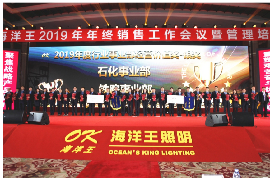
行业经营价值产出银奖：石化事业部、铁路事业部