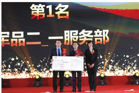
优秀服务部第一名： 军品二服务中心_一服务部