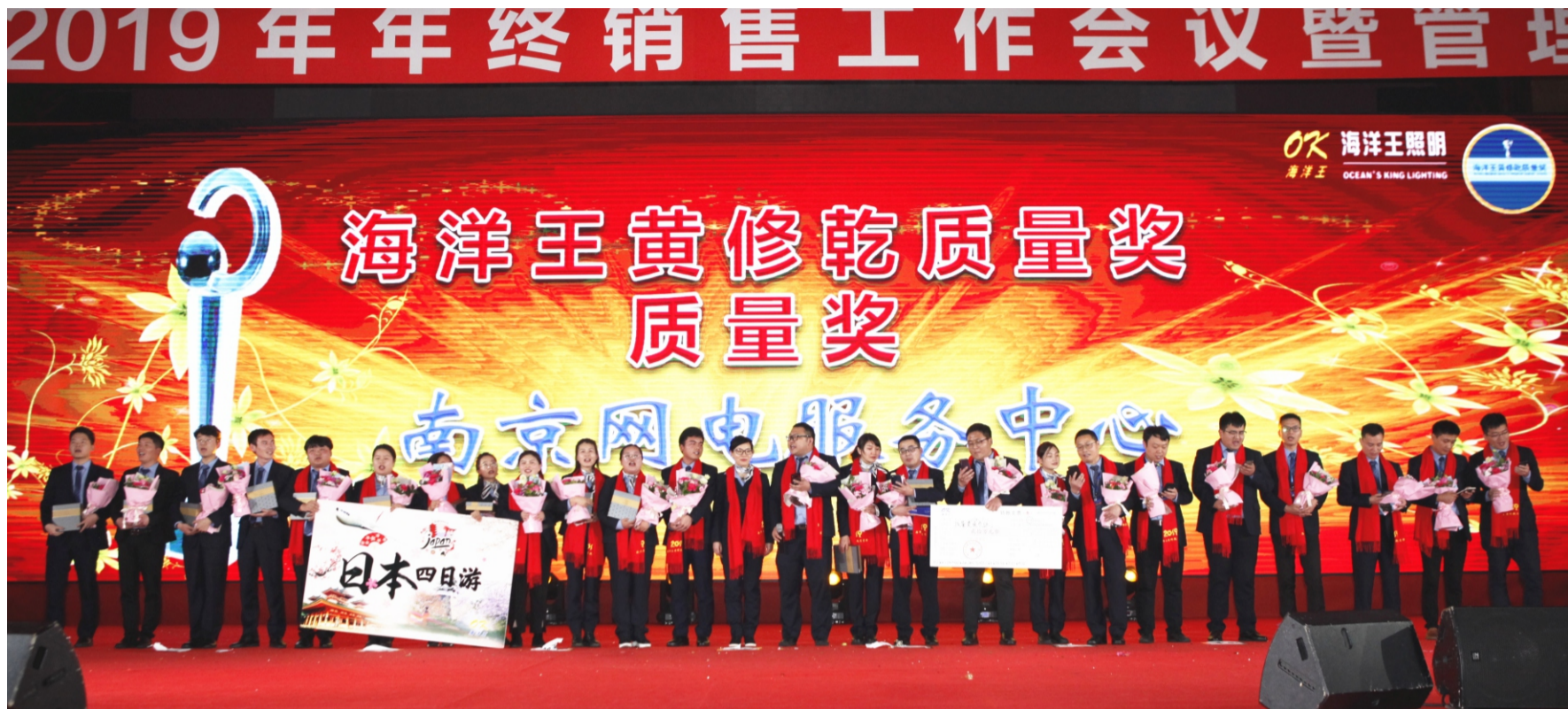
“黄修乾质量奖”质量奖：南京网电服务中心