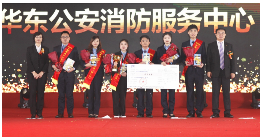
服务中心优秀奖第二名：华东公安消防服务中心