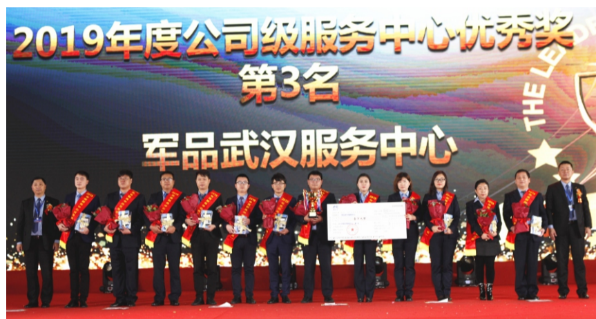
服务中心优秀奖第三名：军品武汉服务中心