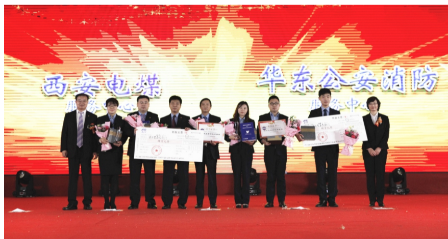
“黄修乾质量奖”提名奖： 西安电煤服务中心、华东公安消防服务中心