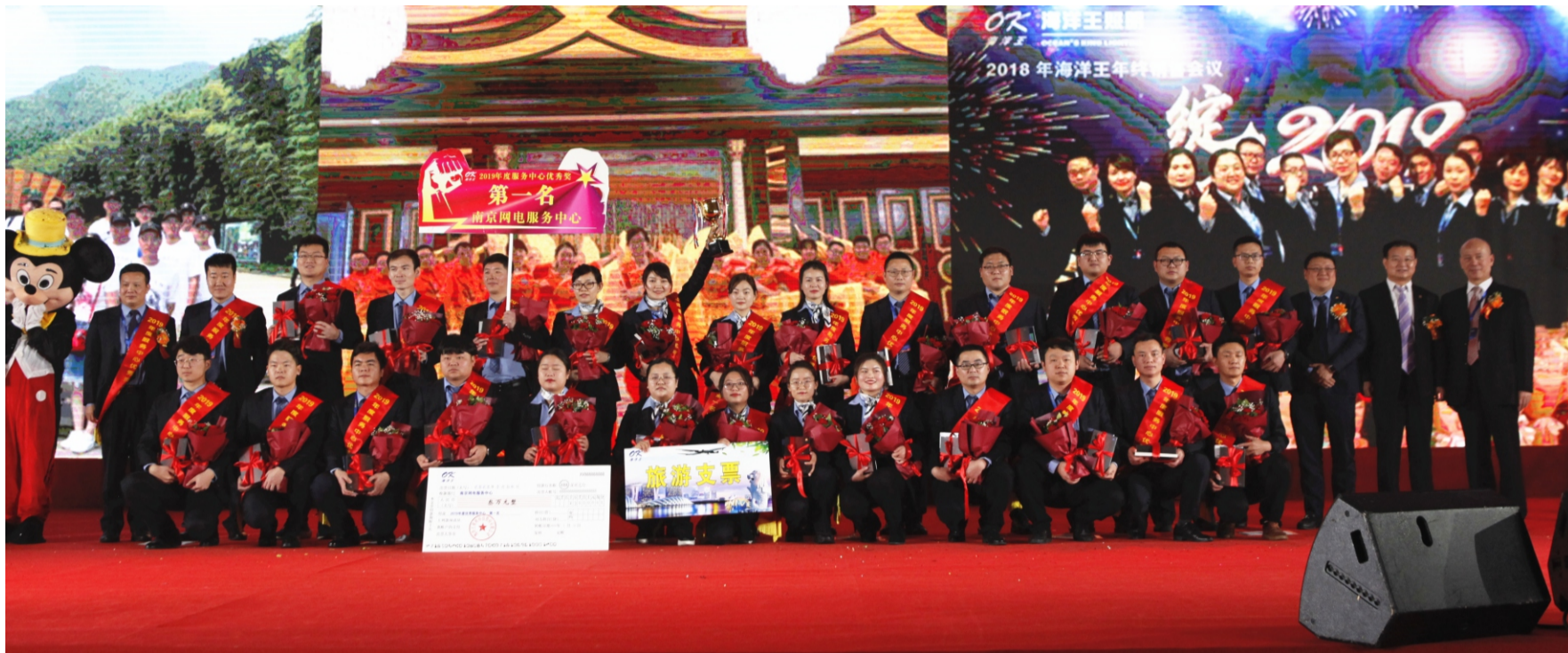
服务中心优秀奖第一名：南京网电服务中心