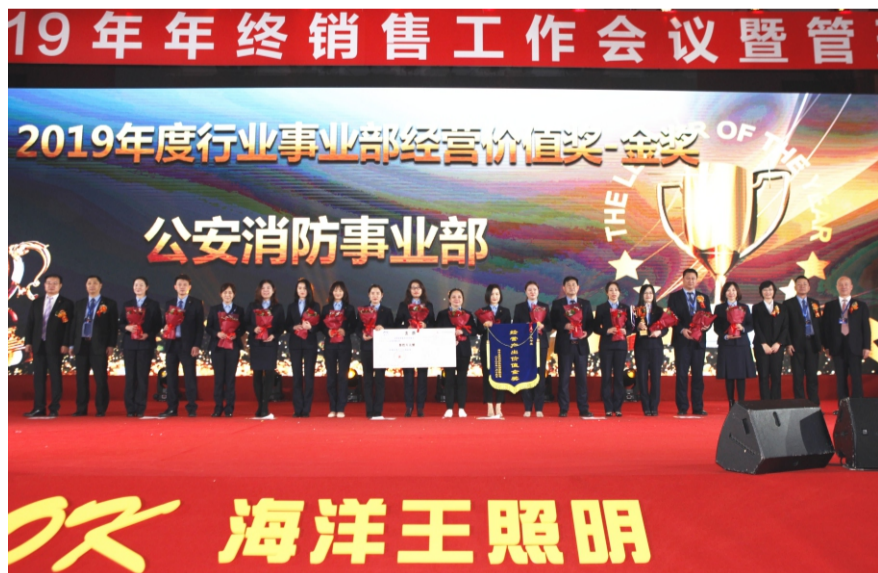
行业经营价值产出金奖：公安消防事业部