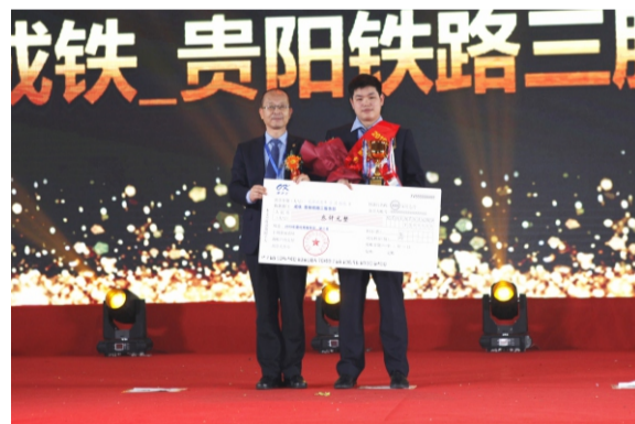
优秀服务部第三名： 成铁服务中心_贵阳铁路三服务部