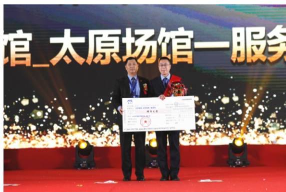
优秀服务部第二名： 北京场馆服务中心_太原场馆一服务部