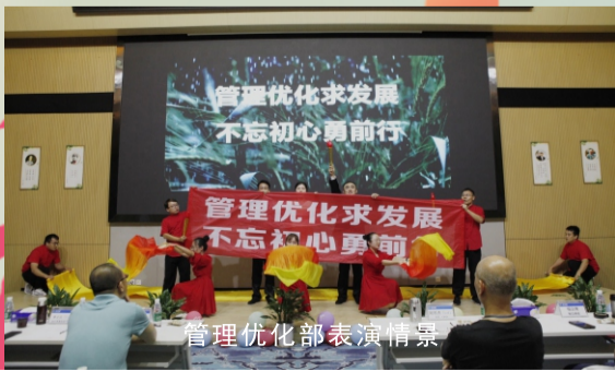
管理优化部表演情景