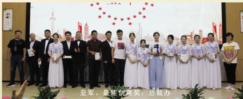
亚军、最佳创意奖：总裁办