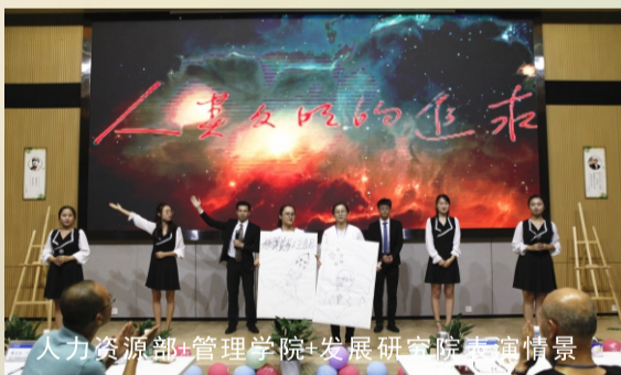
人力资源部+管理学院+发展研究院表演情景