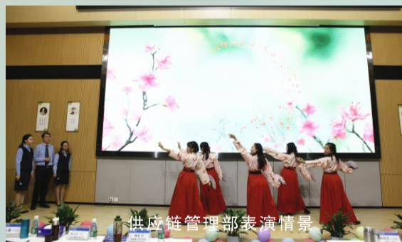
供应链管理部表演情景