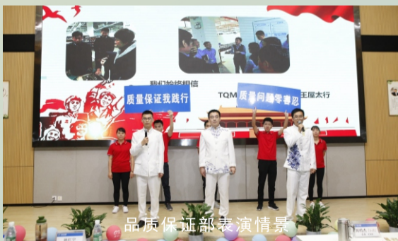
品质保证部表演情景