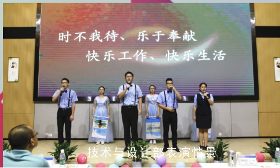
技术与设计部表演情景