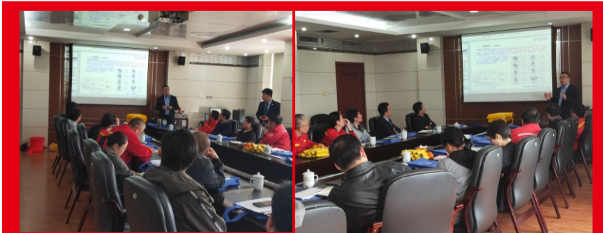
4月28日，天津石化服务中心与客户召开技术交流会。客户多个部门的重要领导和使用单位的主要负责人共计19人参加了交流会，客户认真听取并当场对公司产品优势与特点进行反馈，对公司人性化和具有特色的设计给予高度评价和赞扬。如：有的灯具具有轻便和长时间照明功能，不仅让工作人员使用

社会给予我们很多，我们有责任回报社会，要做一个关注社会责任、践行社会的员工，海洋王始终没有忘记这一点。作为一名海洋王人，我们应该为此感到骄傲而自豪。作为个体员工，我们也要常常提醒自己：公司在关注社会责任的同时，我个人又应该做什么？我对公司的社会责任承诺书，认真履行了每条责任吗？