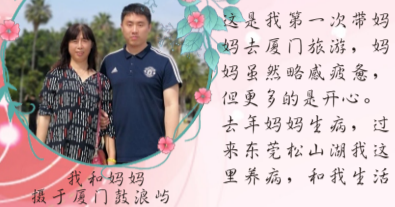
我和妈妈 摄于厦门鼓浪屿

这是我第一次带妈妈去厦门旅游，妈妈虽然略感疲惫，但更多的是开心。去年妈妈生病，过来东莞松山湖我这儿养病，和我生活