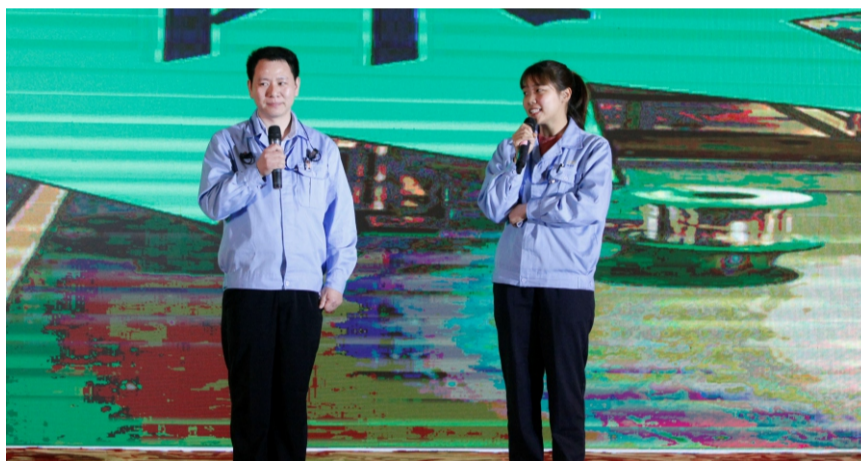
供应链管理动感旋律圈发表情景