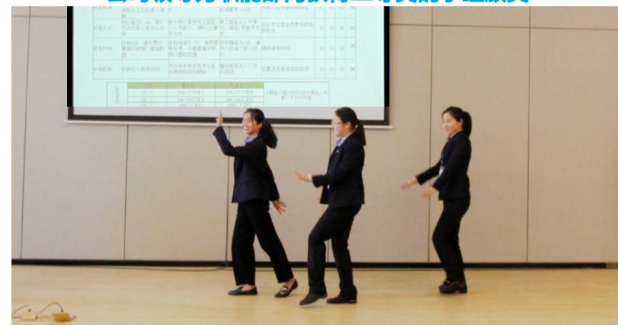
人力资源部极地阳光圈发表情景