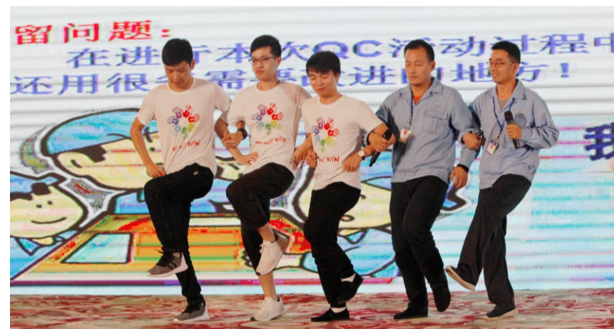
技术与设计部南极圈发表情景