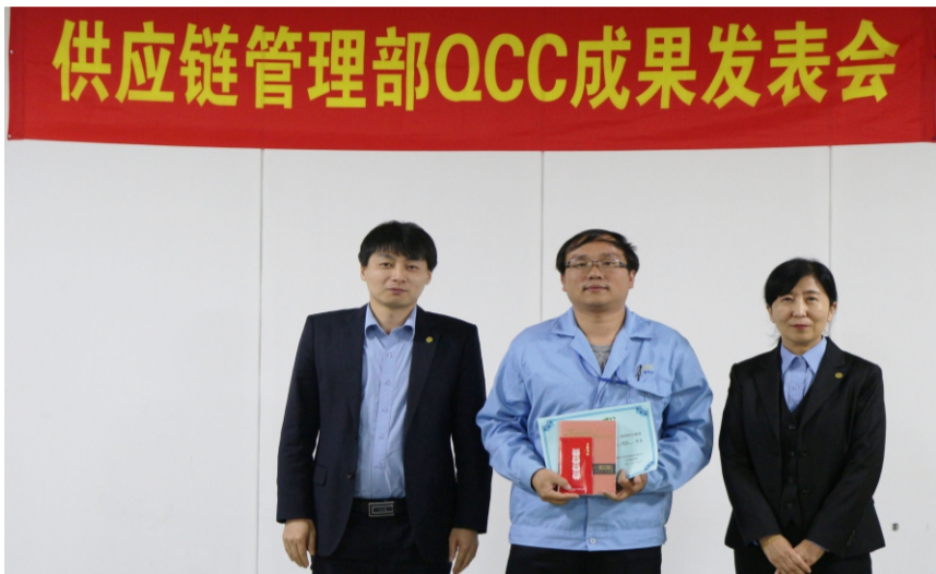
公司领导为供应链管理部分获得一等奖的小组颁奖

部QA圈采用课题达成型课题形式开展QCC活动。最后技术与设计部南极圈获得一等奖，并代表职能部门参加公司级QCC发表赛。