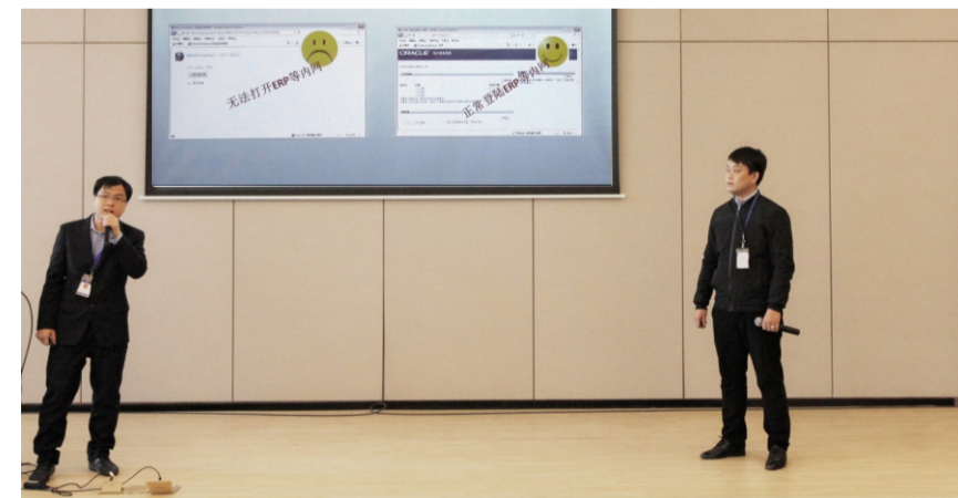
管理优化部快车圈发表情景