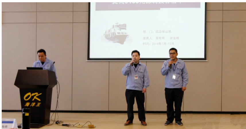
品质保证部钢铁长城圈发表情景