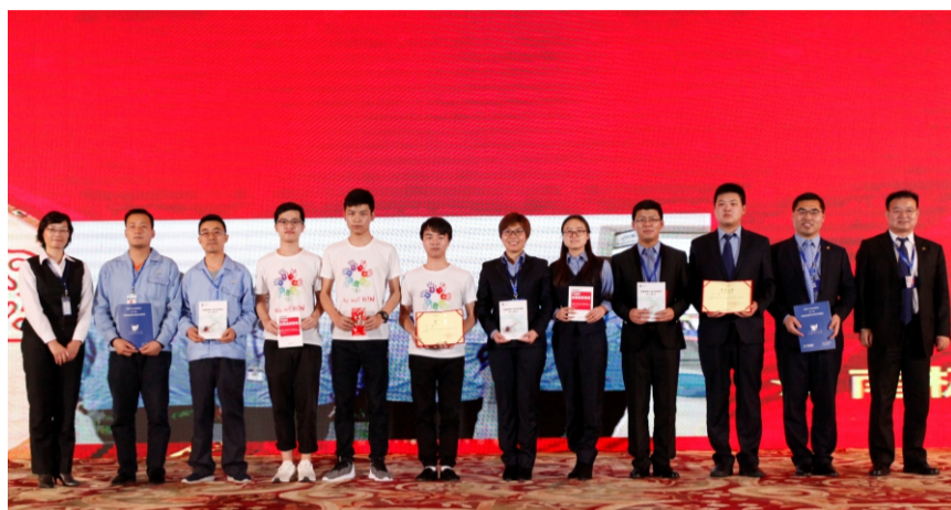
公司领导为获得二等奖的小组颁奖