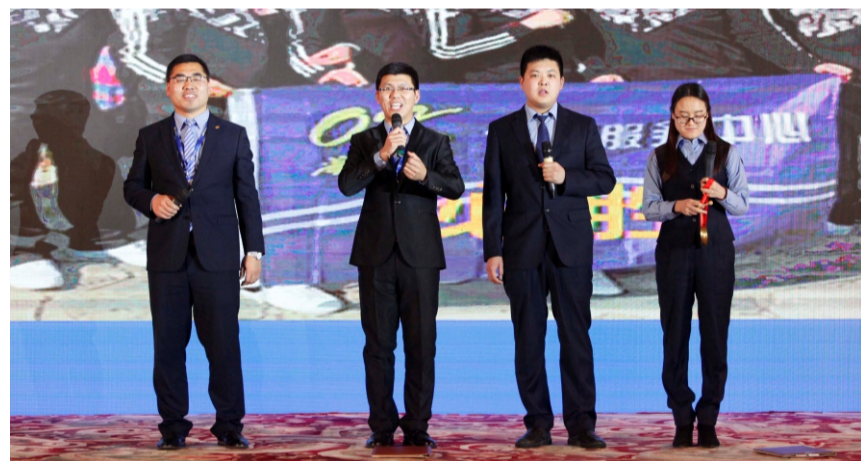
北铁京门圈发表情景