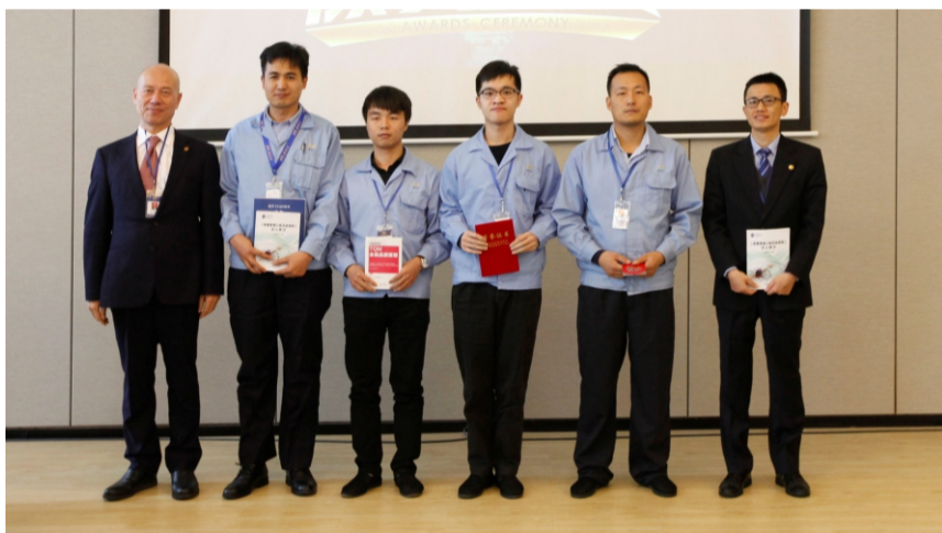
公司领导为职能部门获得一等奖的小组颁奖