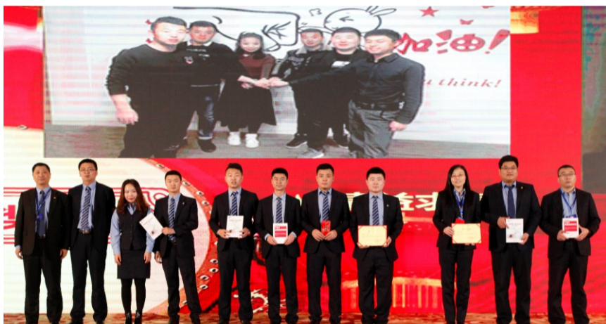
公司领导为获得三等奖的小组颁奖