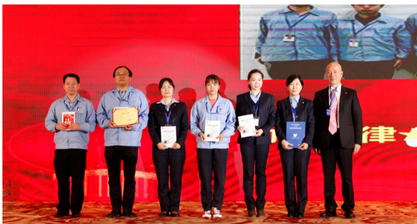
公司领导为获得一等奖的小组颁奖