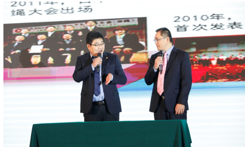
天津石化百丈冰圈发表情景