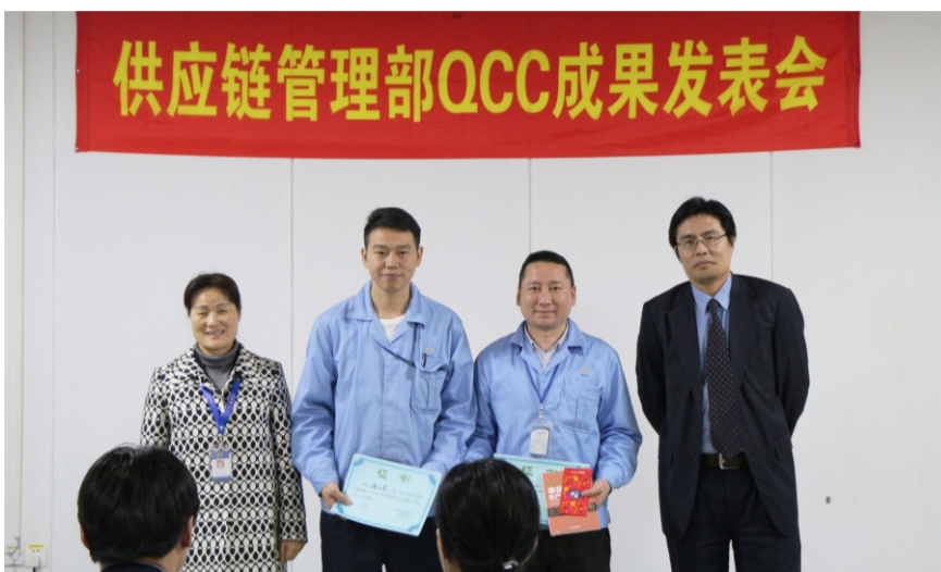
公司领导为供应链管理部分获得二等奖的小组颁奖