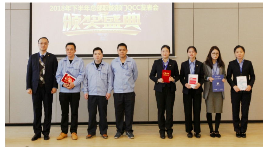
公司领导为职能部门获得二等奖的小组颁奖