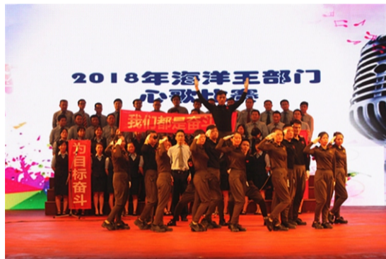
供应链管理部表演心歌《我是一个兵》