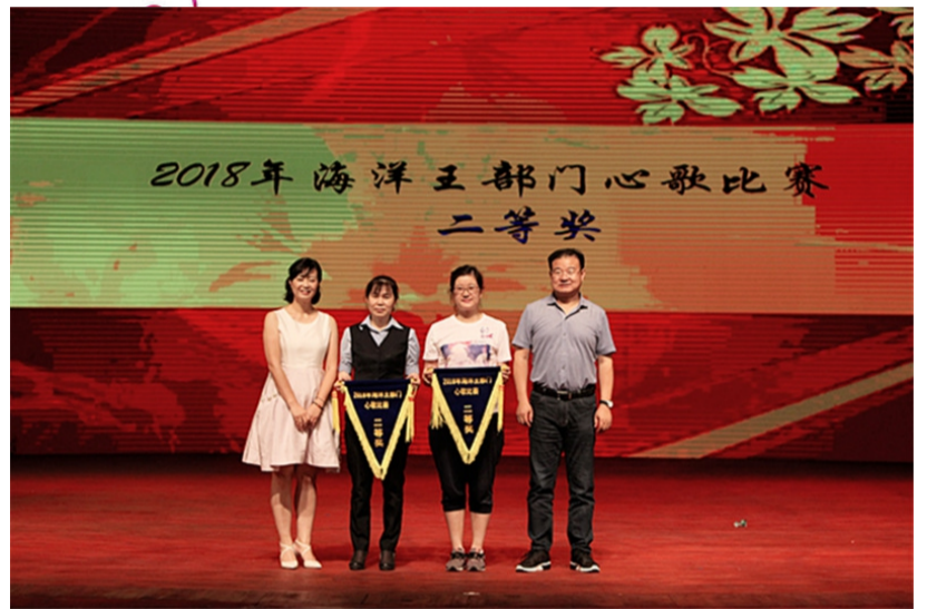
公司领导为总部心歌比赛获得“二等奖”的团队颁奖