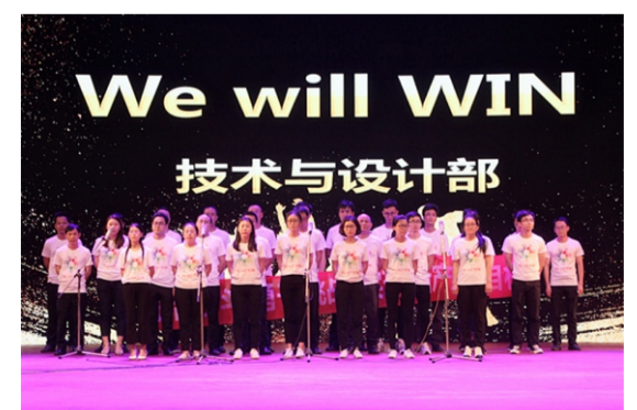
技术与设计部表演心歌《we will win》