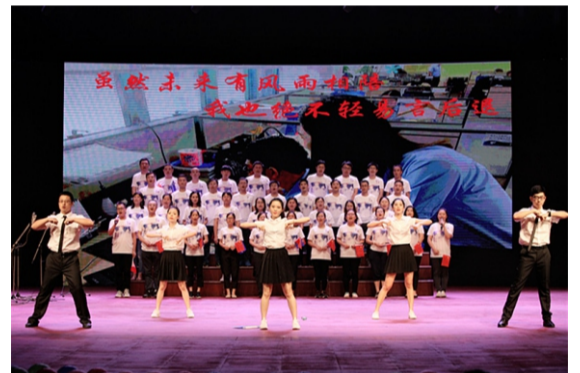
市场部表演心歌《奋斗的青春最美丽》