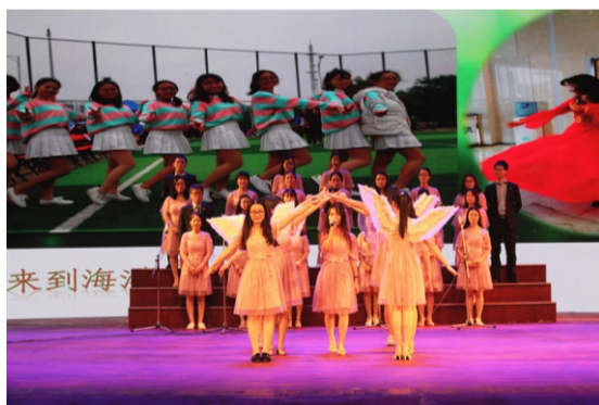
财务部表演心歌《挥着翅膀的女孩》