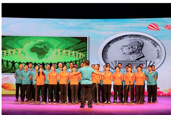
品质保证部表演心歌《咱品质的人》