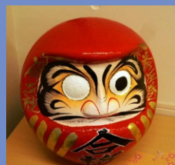
6月13日，今年公司正式争创戴明奖进入倒计时。为此，日本专家从日本带来达摩福娃，请公司领导点睛。用达摩

福娃祈福是日本民间特有的一项传统。相传达摩祖师历尽七灾八难，坚持九年，终于参透佛法。所以大家只要对达摩福娃许愿便可以顺顺利利。日本专家赠送达摩福娃，也是希望给公司带来好运，同时表达对公司全员持续深入推进TQM的认可，并且勉励公司朝着目标，不达目的不要休。