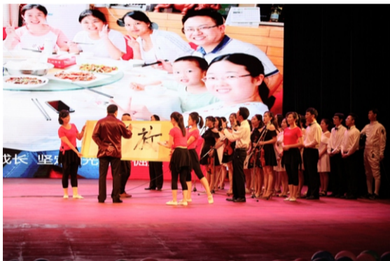
人力资源部、管理学院、发展研究院 表演心歌《奋斗吧！梦在前方》