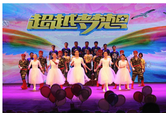
管理优化部、TQM推进部、审计监察部、 战略发展部表演心歌《超越梦想》