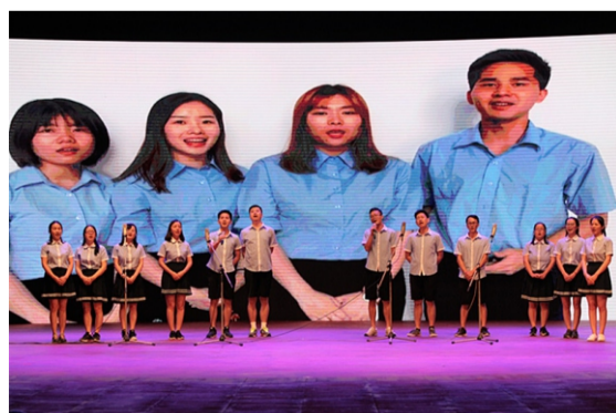
国际部表演心歌《相信我们会创造奇迹》