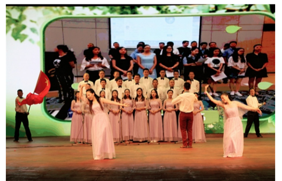
总裁办表演心歌《我爱你中国》