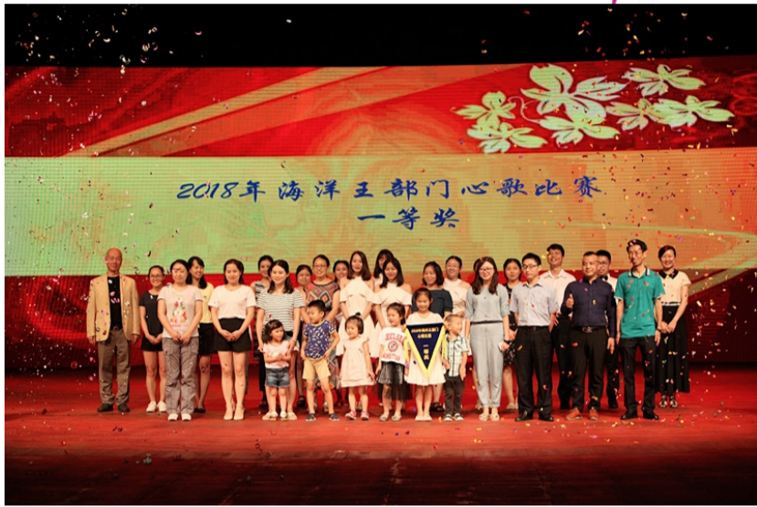
董事长为总部心歌比赛获得“一等奖”的团队颁奖