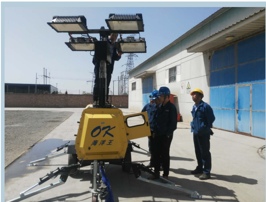
5月7日，在白银市某客户公司应急仓库，兰州网电对6130B灯塔进行维护。期间，还对配电工区和变电工区应急基干队员进行灯塔操作和维护培训，为汛期应急抢险提前做好准备。